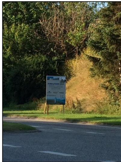
Eksempler på banner og skilte, som er placeret langs indfaldsvejene til Hjørring. Fremover vil de skulle vises på byportalen.