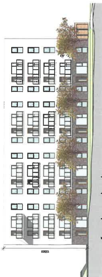
facade mod syd 1 : 200