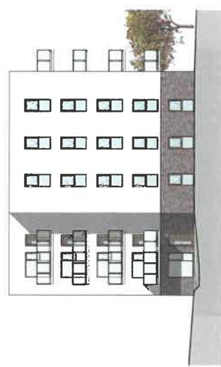
Facade mod vest 1 : 200

Levering ved besøgsseddelingen på byggepladsen. 1,0m ud fra facade. Afdækning på 4,0m.