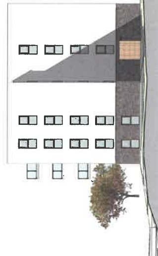
Facade mod øst 1 : 200